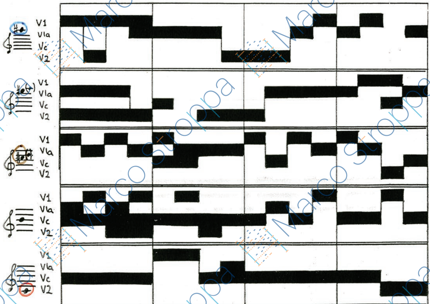
Figure 3: trajectoires instrumentales-spatiales des différents matériaux présentés dans la figure 2. Figure 3a: trois matériaux: maximum de dynamique (cercles), trémolo ordinaire (croix) et trémolo sur le chevalet sur le sol à vide (rectangles); figure 3b: cinq hauteurs indépendentes